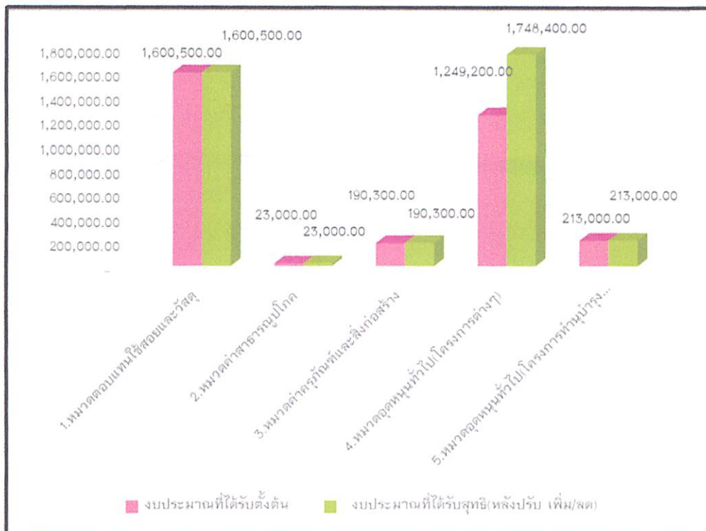
แผนภูมิแสดง: เปรียบเทียบ งบประมาณตั้งต้นและงบประมาณที่ได้รับสุทธิ (หลังปรับ เพิ่ม/ลด)

งบประมาณที่กองกลางได้รับจัดสรรประจำปีงบประมาณ 2567 จำนวน 3,276,000 บาท และในระหว่างเดือน ธันวาคม 2566 รับงบประมาณจากส่วนงานบริหารเข้าโครงการ meeting of the mind (ค่าจัดทำสื่อ) (ข้อมูล ณ 2 มกราคม 2567)