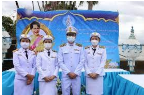
ช่วงเช้า