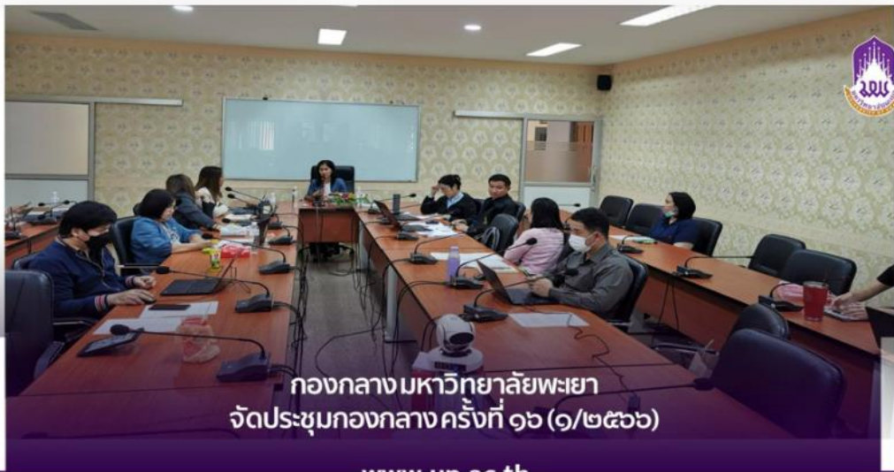
กองกลางมหาวิทยาลัยพะเยา จัดประชุมกองกลาง ครั้งที่ ๑๖ (๑/๒๕๖๖)